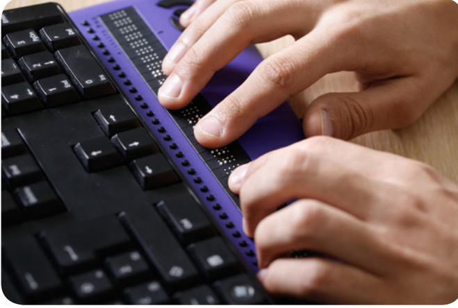
Şekil 3. Bilgisayar klavyesine eklenebilen braille klavye.

Günümüzde artık teknolojiye de yerini alan braille daha uzun yıllar görmeyen bireylere hizmet vermeye devam edecektir. Okullarda da görmeyen bireylere okuma yazma öğretimi braille yazı ile yapılmaktadır. Bu nedenle özel eğitim öğretmenlerinin özellikle de görmeyen bireylerle çalışacak öğretmenlerin bu yazı aracını öğrenmeleri önemlidir.