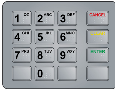
Şekil 2. ATM tuş takımı.